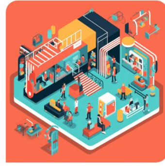
Eventi aziendali o culturali